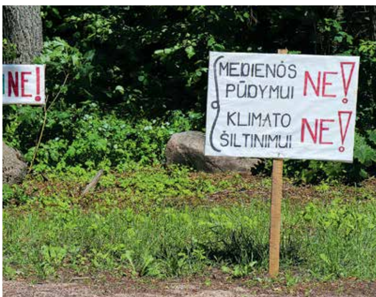
Punios krašto gyventojai norėtų, kad Punios šilas netaptų uždara teritorija, į kurią jie net kojos negalėtų įkelti.