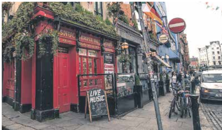
Airijos vyriausybės sprendimu, šią savaitę šalyje savo duris atvers bažnyčios, kino teatrai, teatrai, kavinės ir restoranai, tačiau viešajame

transporte ir toliau privaloma dėvėti veido kaukes. Airijos premjeras Leo Varadkaras taip pat paskelbė, kad iš kai kurių valstybių į Airiją atvykusiems žmonėms nuo liepos 9 d. bus privaloma 14 dienų saviizoliacija, tačiau valstybių sąrašas kol kas nėra parengtas. Nuo pirmadienio taip pat atsidarė muziejai, meno galerijos, grožio salonai ir viešbučių barai. Patalpose jau gali rinktis iki 50 žmonių, o lauke – iki 200, tačiau vyriausybė ragino žmones laikytis fizinio atstumo rekomendacijų. Planuojama karantino apribojimus dar labiau švelninti liepos 20 d., kuomet atsidarys barai ir kazino.