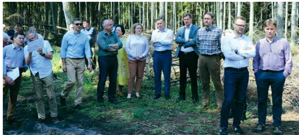
Ne vienerius metus mokslininkai bei valdininkai sprendžia, kokie šio unikalaus gamtos kampelio apsaugos tikslai.