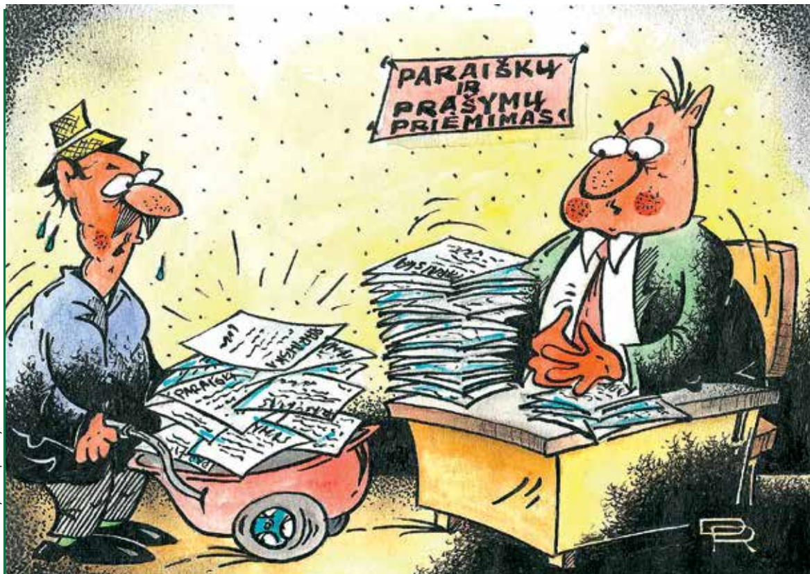
Rimantas Dovydeno piešinys