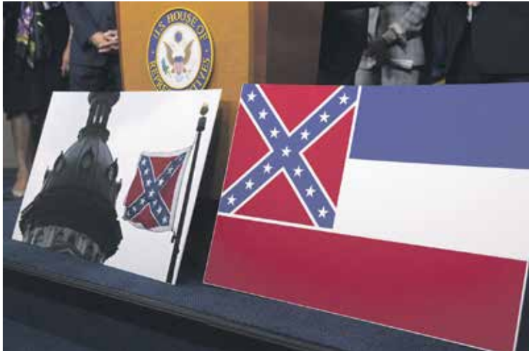
Abeji Misisipės valstijos (JAV) Įstatymų leidžiamojo susirinkimo rūmai balsų dauguma pritarė įstatymo projektui dėl valstijos vėliavos

pakeitimo. Norima, kad ji nebeprimintų vėliavos, su kuria Konfederacijos kariai JAV Pilietinio karo metais (1861–1865) kovojo už vergijos išsaugojimą. Skelbiama, kad per balsavimą Įstatymų leidžiamojo susirinkimo aukštuosiuose rūmuose buvo siūloma surengti referendumą šiuo klausimu, bet pasiūlymas buvo atmestas. Dabartinės vėliavos tučtuojau bus atsisakyta, taip pat bus sudarytas komitetas, kuris parengs naują dizainą. Jis bus pateiktas rinkėjams tvirtinti lapkričio mėnesį. Dabartinė Misisipės valstijos vėliava: mėlyna-balta-raudona trispalvė su horizontaliomis juostomis, kurios viršutiniame kairiajame kampe yra Konfederacijos kovinė vėliava – mėlynas kryžius su baltomis žvaigždėmis raudoname fone. Su šia emblema pietiečiai kovėsi su šiauriečiais.