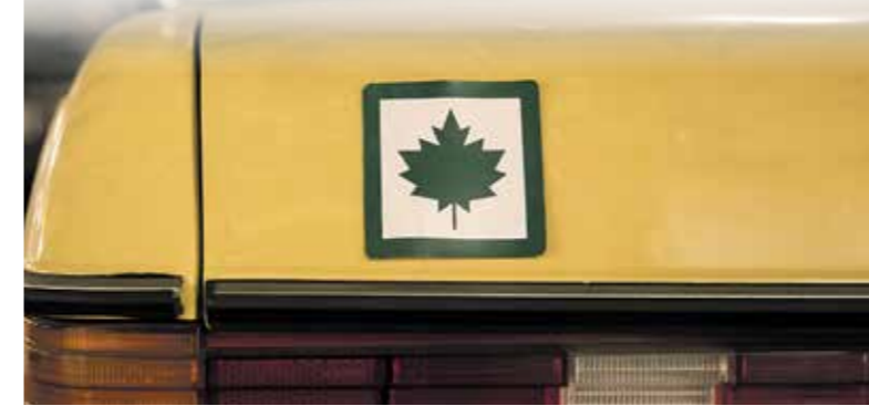
Vidutinė žala, kurią eismo įvykiu metu sukelia pradedantieji vairuotojai, šiemet siekia daugiau nei 1,5 tūkst. eurų.

Nuo metų pradžios Lietuvos kelių policijos tarnyba užfiksavo beveik 100 pradedančiųjų vairuotojų sukeltų eismo įvykių, kuriuose nukentėjo žmonės. Tai – 16 procentų mažiau nei pernai tuo pat metu. Pradedančiųjų vairuotojų sukelti eismo įvykiai dažniausiai nutinka dėl nesaugaus greičio, netinkamai pasirinkto atstumo iki kitos transporto priemonės, neįvertintų oro bei kelio sąlygų.