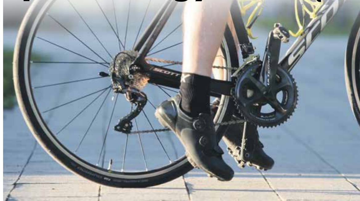
Praėjusiais metais vidutinė vieno pavogto dviračio vertė viršijo 620 eurų.

Kasmet šiltuoju sezonu vis daugiau gyventojų sėda ant dviračių, o pasibaigus karantinui ir laikantis vasariškiems orams, dviratininkų šalies miestuose ir miesteliuose tik daugės. Tačiau vasara daliai dviratininkų paprastai reiškia ir nuostolius bei nemalonius rūpesčius – aktyvėja ir vagys.