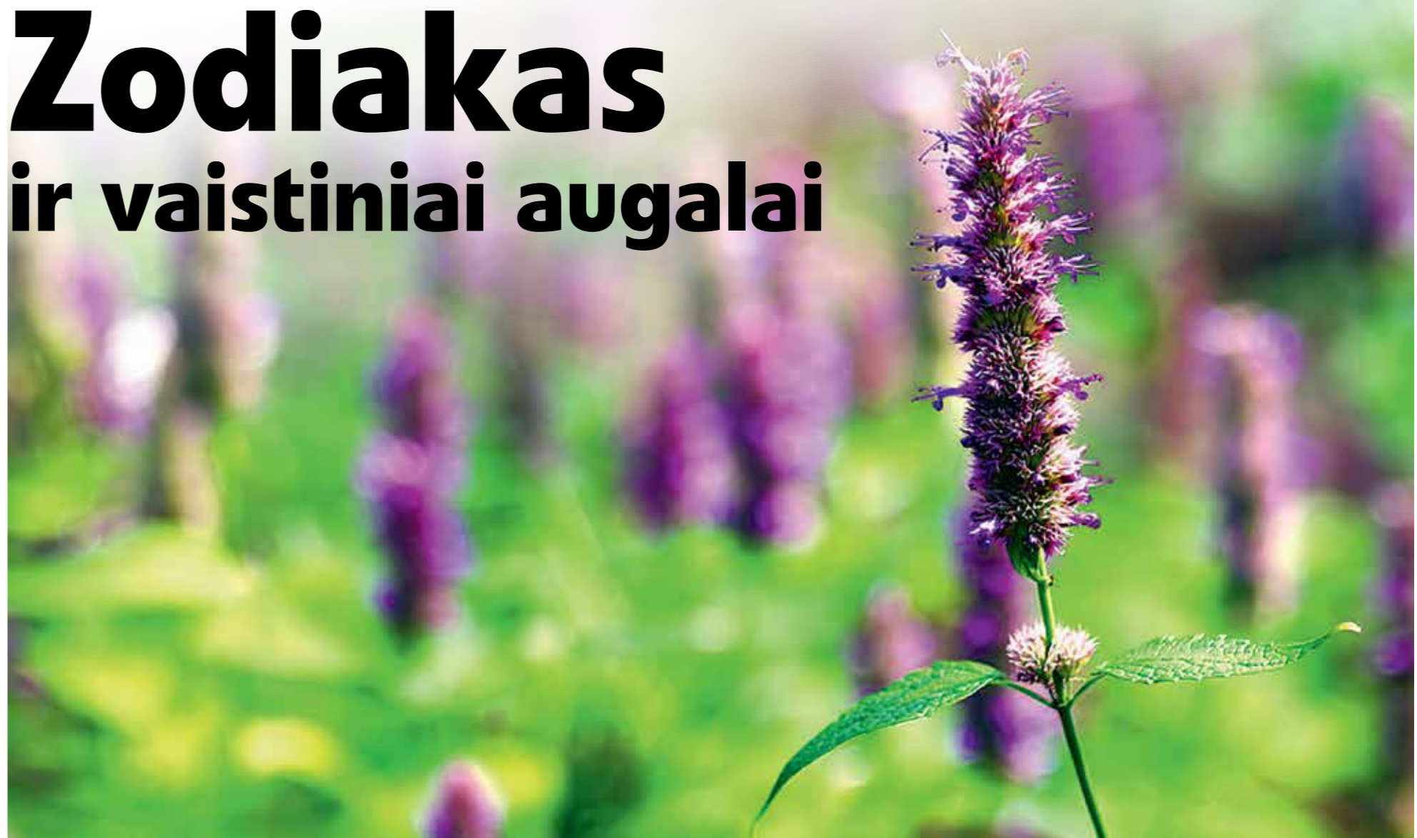
Gydymasis tampa efektyvesnis, kai sutampa žmogaus ir vaistinio augalo Zodiakai.