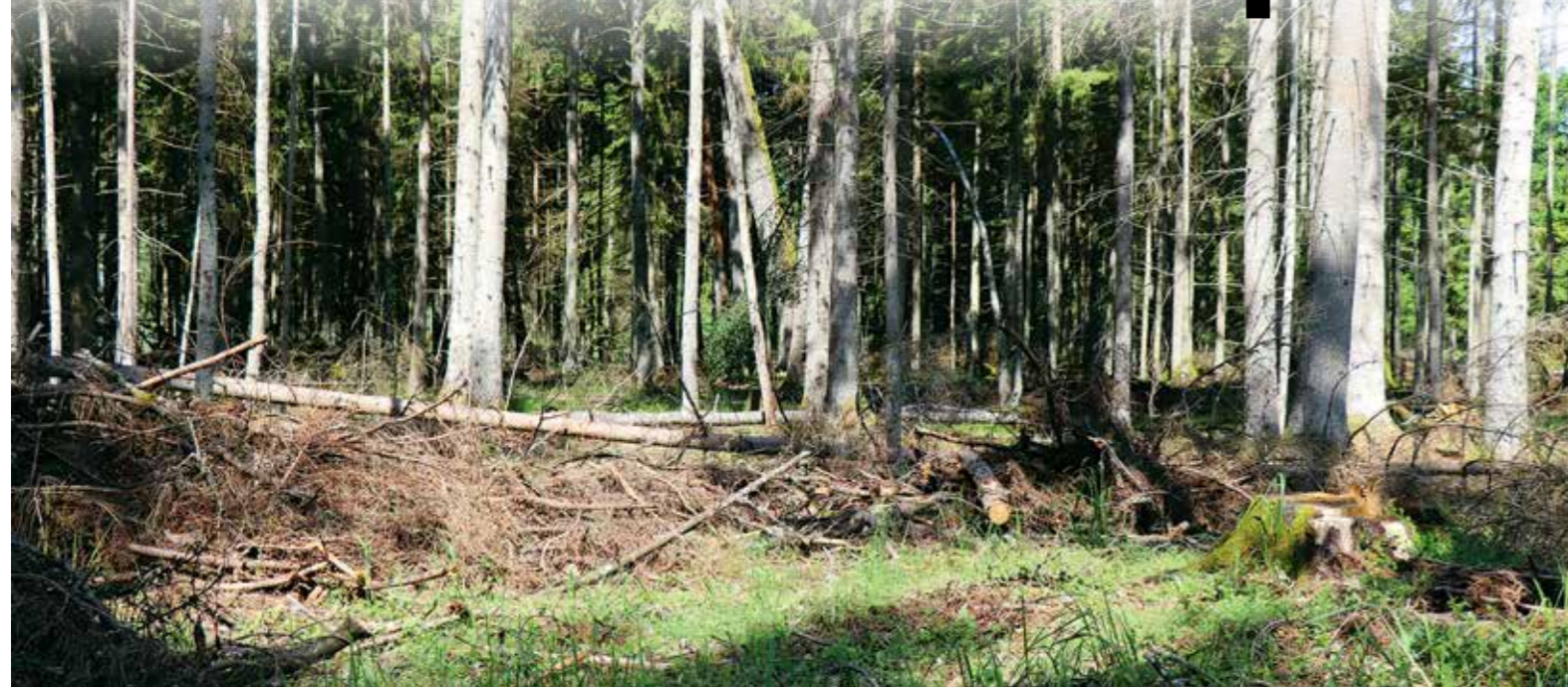
Kinivarpos jau sunaikino apie 15 proc. Punios šilo eglių, užpuolė pušis ir persimetė į gretimus miškus.