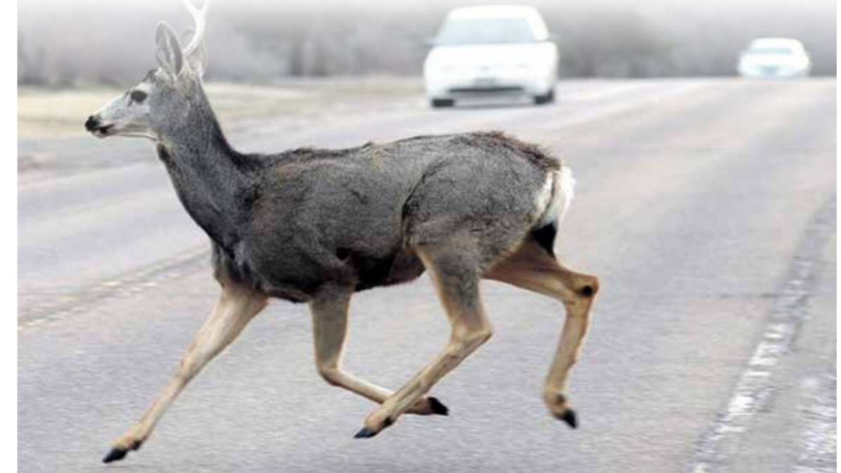
Kiekvieną parą Aplinkos apsaugos departamentas sulaukia apie pusšimtį skambučių, kurių didžioji dalis susijusi su automobilių užmuštais ar sužalotais laukiniais gyvūnais.

Aplinkos apsaugos departamentas teigia gaunantis kone dvigubai daugiau pranešimų apie laukinius gyvūnus keliuose: 2015 metais fiksuota per 5,5 tūkst., o 2019-aisiais – beveik 10 tūkst. pranešimų. Kiekvieną parą departamentas sulaukia apie pusšimtį skambučių, kurių didžioji dalis susijusi su automobilių užmuštais ar sužalotais laukiniais gyvūnais.