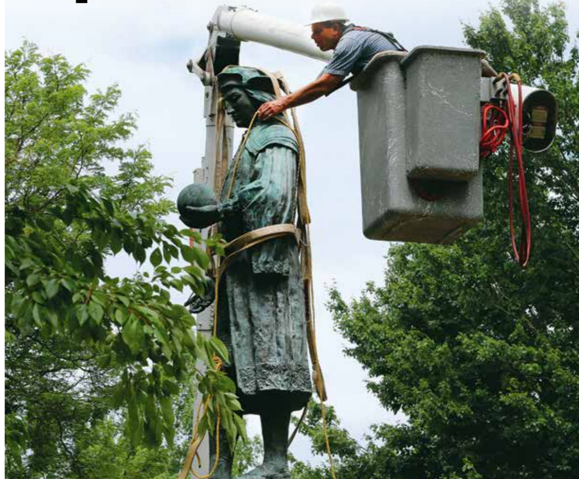
Niu Heivene (Konektikuto valstija) demontuojamas 1955 m. pastatytas paminklas Amerikos atradėjui Kristupui Kolumbiui.

Karas su paminklais, į kurį JAV federalinė valdžia iš pradžių neįsiklėjo, palikdama sprendimų teisę valstijų gubernatoriams, miestų merams ir kitiems vietinės valdžios atstovams, birželio pabaigoje vis tik perėmė JAV prezidento Donaldo Trampo kantrybės taurę. Ranką prieš istorinį paveldą keliančius asmenis išvadindęs vandalais, jis prarasino „atsakyti“ aktyvistams, siekiantiems Amerikos sostinėje nuverti istorinių asmenybių skulptūras. „Kazkurio metu bus sulaukta atpildo, nes turi būti tam tikras atpildas. Še žmonės yra vandalai, jie yra agitatoriai, jie iš tikrųjų yra tam tikra prasme teroristai“, – pareiškė prezidentas. Įkvėpti nebaudžiamumo, judėjimo „Juoduųjų gyvybės